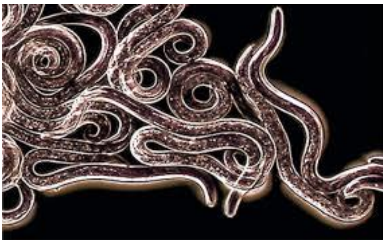
Hjerteorm fundet i en Baermann undersøgelse